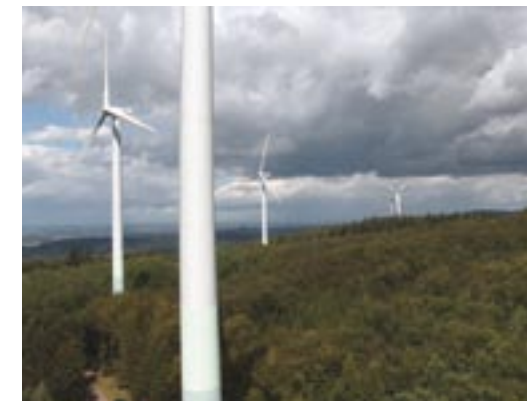
Parc éolien en Forêt Noire, Allemagne. Les populations locales de pipistrelles communes ( Pipistrellus pipistrellus ) ont été affectées par ces éoliennes, ainsi que des espèces migratrices telles que la Noctule de Leisler ( Nyctalus leisleri ).

L'information existante et l'étude du site doivent servir pour déterminer si la présen-