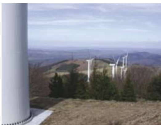
Parc éolien construit en 2002 (Aveyron, France), sur une crête en bordure de hêtraie. A cette époque l'impact des éoliennes sur les chauves-souris n'était guère connu et elles n'étaient pas prises en compte dans l'étude d'impact.

La section suivante fournit des informations sur des évaluations d'impact qui ne sont pas imposées par la loi. Les développeurs devront aussi entreprendre des études en bonne et due forme pour répondre, si nécessaire, aux exigences de l'Évaluation d'Impact Environnemental. Là où il est probable qu'un projet de développement aura des effets environnementaux importants sur les chauves-souris (e.g. effets sur les gîtes, les couloirs de vol, les zones d'alimentation et les migrations saisonnières), une évaluation d'impact environnemental sera requise avant qu'un service instructeur ne puisse décider d'accorder ou non le permis de construire.