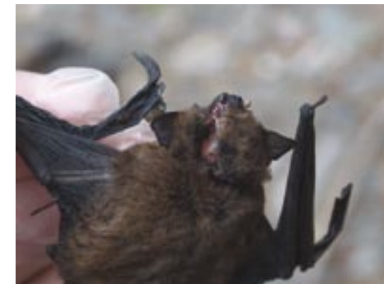
Pipistrelle commune ( Pipistrellus pipistrellus ) avec le crâne fracturé, retrouvée morte sous une éolienne (Allemagne). Même des espèces connues pour voler à faible hauteur sont victimes des éoliennes.

Exception faite des périodes crépusculaires (soir et matin) où les chauves-souris peuvent être vues, l'étude du comportement des Chiroptères repose sur des technologies onéreuses telles que des caméras infrarouges, soit à images thermiques, soit avec un puissant illuminateur infrarouge. Compte tenu de son prix, l'utilisation de ce matériel est limitée soit à des sites problématiques, soit à la recherche fondamentale. Cependant, avec un détecteur d'ultrasons, un manipulateur peut obtenir des indices sur le comportement des chauves-souris ou du moins différencier les actions de chasse du simple passage.