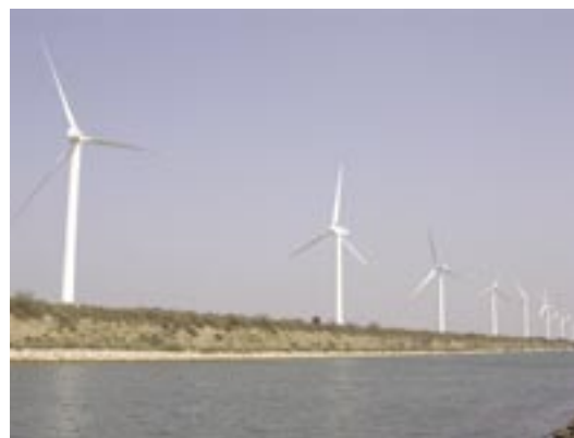
Parc éolien dans le delta du Rhône (Camargue, sud de la France). 21 éoliennes construites en 2005 sur une digue. En 2006, 12 chauves-souris ont été retrouvées mortes, dont le Minioptère de Schreibers (Miniopterus schreibersii). Le permis de construire fut accordé à une époque où le diagnostic chiroptérologique n'était pas nécessaire pour l'étude d'impact, bien que cette zone humide (site Ramsar) soit un site névralgique pour l'hivernage des oiseaux et pour les chauves-souris en chasse et en migration.