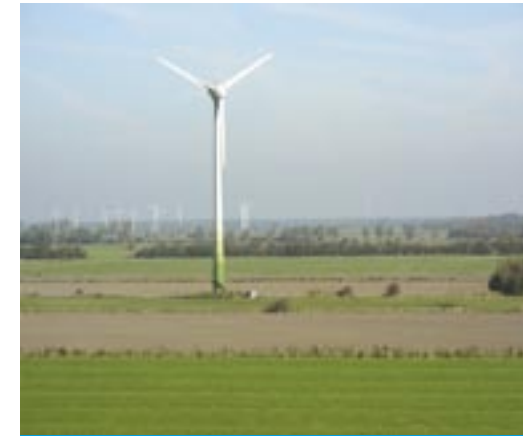
Parc éolien du nord de l'Allemagne. Sérotine (Eptesicus serotinus) et Pipistrelle (Pipistrellus pipistrellus) utilisent régulièrement ce paysage structuré pour chasser. Pour éviter la mortalité, il convient de respecter la distance minimale de 200 m par rapport aux structures paysagères.

b) Année 2, suivi : quelles espèces ne réapparaissent pas pendant la construction (vérifier les impacts que les travaux de construc-