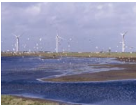
Parc éolien de Bouin (Vendée, France), sur la côte atlantique, où des chauves-souris migratrices sont régulièrement trouvées mortes sous les éoliennes. Les victimes sont principalement des Pipistrelles de Nathusius ( Pipistrellus nathusii ), des Noctules communes ( Nyctalus noctula ) et des Pipistrelles communes ( Pipistrellus pipistrellus ).

Un chien dressé pour marquer l'arrêt sur des chauves-souris peut être utilisé pour rechercher les victimes, mais son efficacité sera testée de la même façon que précédemment. Il faut préférer un chien d'arrêt à un retriever pour que son maître puisse localiser et noter l'endroit exact où la victime est tombée.