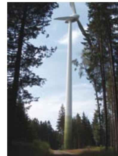
La construction d'éoliennes en forêt étant extrêmement dangereuse pour les chauves-souris, elle est déconseillée par les présentes lignes directrices.

En règle générale, les éoliennes ne doivent pas être installées dans les forêts, ni à une distance inférieure à 200 m, compte tenu du risque qu'implique ce type d'emplacement pour toutes les chauves-souris. A proximité des bois, la question de la hauteur doit être soulignée. Il convient d'apporter une attention particulière à l'activité des chauves-souris au-dessus de la canopée. Des caméras à images thermiques et des ballons/cerfs-volants avec détecteurs d'ultrasons donneront une indication de hauteur. Les radars, s'ils s'avèrent opérationnels, peuvent être moins utiles près des