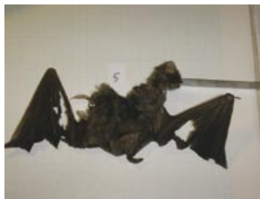
Différentes espèces migratrices de chauves-souris ainsi que des espèces locales sont victimes des éoliennes dans toute l'Europe. Les Noctules communes ( Nyctalus noctula ) sont les espèces les plus affectées par les éoliennes en Allemagne (ici le parc de Puschwitz en Saxe).