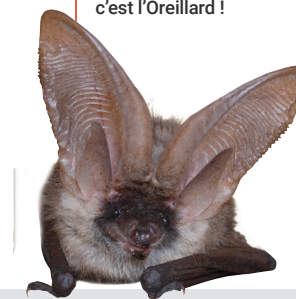
Le roi des grandes oreilles, c'est l'Oreillard !

“Un ouvrage ludique et pédagogique qui tord le cou aux idées reçues sur les chauves-souris.”