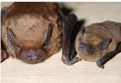
Inutile de mesurer pour savoir quelle est la Pipistrelle (à droite) et quelle est la Noctule (à gauche)...