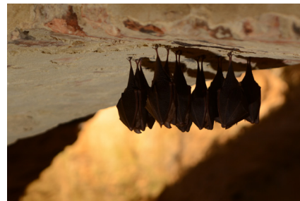
Chez les Rhinolophes, les petits s'accrochent à leur mère la tête en haut. Tout se remet dans le bon sens dès qu'ils sont aptes au vol : ils deviennent alors des chauves-souris normales, accrochées la tête en bas. Ici, de Petits Rhinolophes en hibernation.

ISBN 978-2-7592-3741-8 Coll. Idées fausses 144 pages couleurs Quæ, 2023, réf. 02894 Prix : 23 €