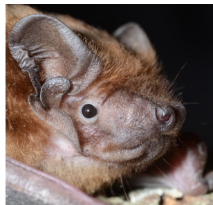
Tête d'une Noctule commune, aux yeux bien fonctionnels.