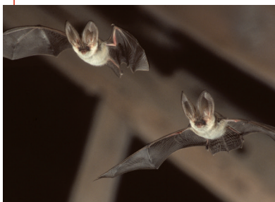
Les Oreillards gris apprécient les greniers chauds.

Superstitions, fables et bestiaires religieux... Les chauves-souris inspirent souvent une répulsion ou une fascination entretenue par des œuvres d'imagination.