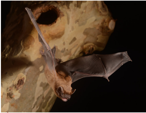
La Noctule commune est intimement liée aux platanes, surtout quand les alignements longent les canaux ou les rivières.