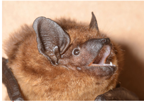
À chaque espèce de chauve-souris une signature acoustique différente. Ici, une Sérotine commune à 25 kHz.