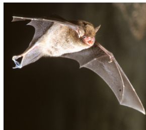
Ce Murin de Daubenton a repéré une petite proie volante.